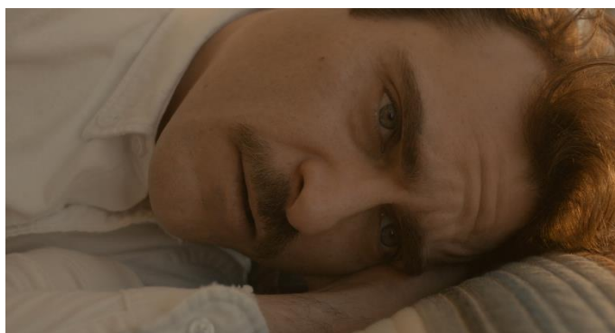
Figure 8 ( Her 1 :51)