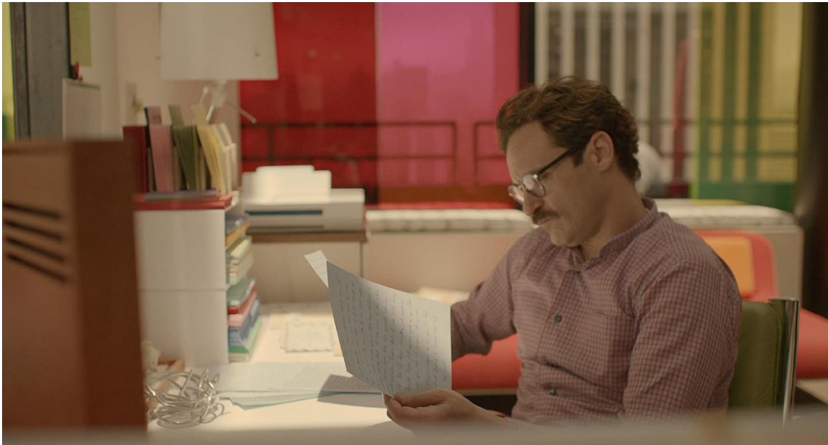
Figure 2 (Her 02:18)

La première conversation entre Theodore et Samantha marque un tournant narratif et émotionnel. Les plans rapprochés sur son visage captent ses micro-expressions : surprise, curiosité, légère excitation. La voix de Samantha, claire et modulée, agit comme un instrument de proximité affective sans présence physique. Les silences, subtilement intégrés entre ses réponses, créent un espace où Theodore projette ses propres émotions. La mise en scène illustre ainsi comment la machine, par sa perfection programmée, peut simuler la présence humaine et produire un lien affectif. Mais ce lien est fondamentalement asymétrique : Theodore investit émotionnellement, tandis que Samantha reste partiellement intangible et programmée pour répondre à plusieurs utilisateurs simultanément, ce qui introduit une première tension sur la nature réelle de la relation.