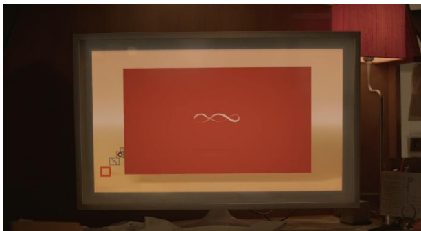
Figure 3 (Her 12:21)

La première conversation entre Theodore et Samantha marque un tournant narratif et émotionnel. Les plans rapprochés sur son visage captent ses micro-expressions : surprise, curiosité, légère excitation. La voix de Samantha, claire et modulée, agit comme un instrument de proximité affective sans présence physique. Les silences, subtilement intégrés entre ses réponses, créent un espace où Theodore projette ses propres émotions. La mise en scène illustre ainsi comment la machine, par sa perfection programmée, peut simuler la présence humaine et produire un lien affectif. Mais ce lien est fondamentalement asymétrique : Theodore investit émotionnellement, tandis que Samantha reste partiellement intangible et programmée pour répondre à plusieurs utilisateurs simultanément, ce qui introduit une première tension sur la nature réelle de la relation.