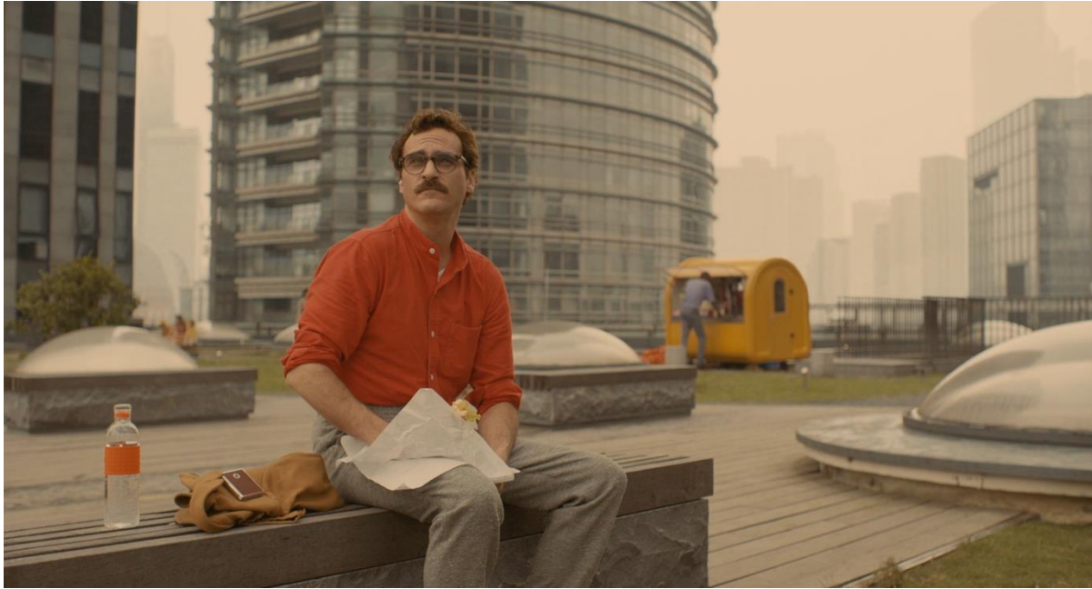
Figure 1( Her 1:13:60)

Le film Her de Spike Jonze met en scène la ville de Los Angeles futuriste, une ville saturée de lumières pastel et de néons doux, où les bâtiments courbes et les ponts suspendus créent une esthétique à la fois accueillante et impersonnelle. La caméra accompagne Theodore 9 dans ses trajets, souvent en plongée ou en travelling lent, soulignant son isolement au sein d'un espace urbain vaste mais socialement distant. Chaque passage dans la ville montre des individus absorbés par leurs appareils personnels, isolés malgré la proximité physique, accentuant la thématique de la déshumanisation collective par la technologie :