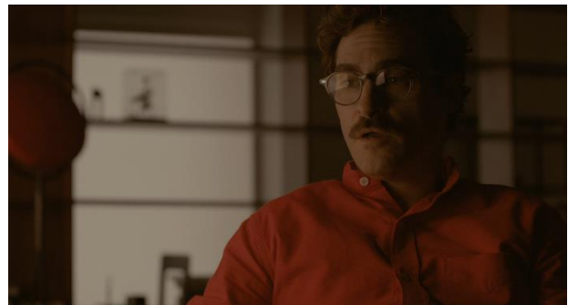
Figure 4 (Her 14:44)

La séquence des lettres d'amour pour d'autres clients illustre de manière frappante la machinalisation de l'émotion. La caméra alterne entre les plans serrés sur les mains de Theodore qui tapent, sur son visage concentré et sur l'écran lumineux où apparaissent les mots. La bande sonore minimaliste accompagne ses gestes répétitifs, renforçant le caractère mécanique de l'activité. Théodore devient un intermédiaire émotionnel, traduisant les sentiments d'autrui sans véritable engagement spontané. La machine devient ici un outil de production affective, et l'émotion, bien que sincère dans sa rédaction, est traitée comme un objet standardisé. Cette séquence souligne