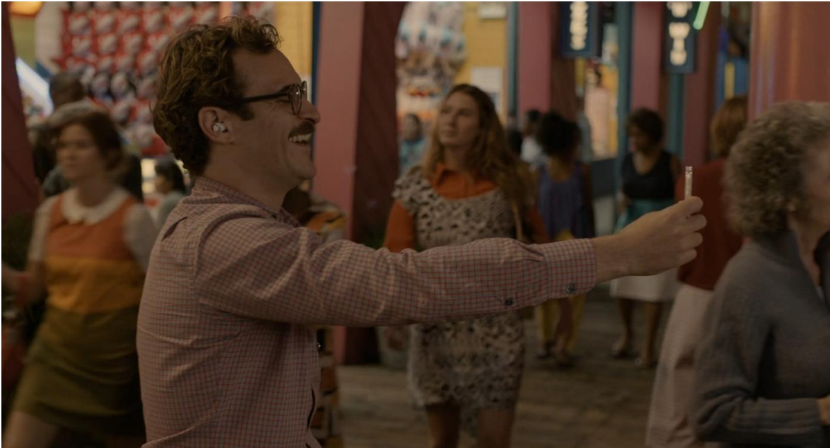
Figure 6 (Her 29:15)

Une autre scène particulièrement révélatrice est celle où Theodore et Samantha explorent la ville ensemble. Bien que Samantha n'ait pas de corps physique, le film la montre via des effets sonores, la spatialisation de sa voix et l'animation graphique sur l'interface. Theodore réagit à chaque commentaire de Samantha, rit à ses plaisanteries et exprime des émotions qu'il n'aurait pas manifestées seul. Le contraste entre le mouvement naturel de Theodore et l'absence physique de Samantha souligne une machinalisation paradoxale : l'homme agit émotionnellement mais au sein d'un cadre totalement artificiel, régi par une intelligence programmée pour répondre et anticiper ses besoins. L'intimité devient ici un processus scénarisé, où les réactions humaines sont encadrées par la machine et sa capacité à simuler la réciprocité.